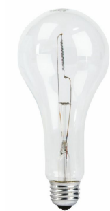
Single Contact Medium Screw