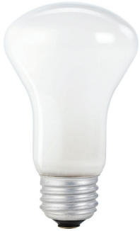
Single Contact Medium Screw