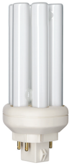
18 W GX24q-2